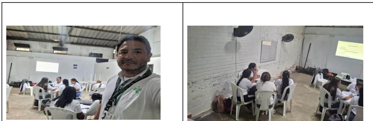
Figura 2. FICHA 3483736 TECNICO PROMOTORES EN SALUD – SANTADER DE QULICHAO

Nota. Formación Ambiente Auditorio de La IPS QULISALUD de Santander de Quilichao Cauca. Mayo 2026